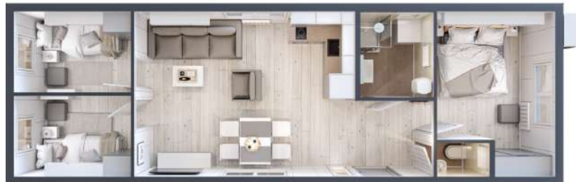
Model I 57m 2

Całoroczny domek mobilny 57m 2 (13,2x4,3m) zaprojektowany do zakwaterowania większej liczby pracowników, odpowiednik hotelu pracowniczego. Plan domku to 3-4 sypialnie z miejscem dla 4-8 osób.